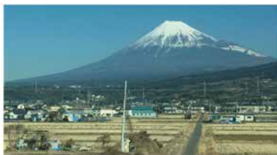
大垣徳洲会病院診察室からの 伊吹山 と新幹線車窓からの 富士山