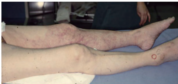
紫色に変色した下肢

今回は急性下肢動脈閉塞症の話をして頂きます。急性下肢動脈閉塞症は、急に下肢の動脈が閉塞し血液が流れなく病気です。症状は急な下肢の痛み、冷汗、感覚鈍麻、麻痺して動かなくなり、脈も触れなくなります。時間が経つと下肢が壊死に陥り、救命のために下肢切断が必要になることがあります。状態にもよりますが発症から6～8時間までに治療しなければ、救肢できないとも言われる緊急を要する怖い病気です。原因としては不整脈によって心臓内にできた血栓が飛んで下肢の動脈を閉塞させる場合(8割くらい)、また閉塞性動脈硬化症などで元々狭窄のある血管内で急速に血栓が成長する場合があります。検査はABI(腕と足の血圧を測る検査)や超音波、CT検査など比較的簡易な方法で調べることができます。治療は外科的に動脈を切開しカテーテルで血栓を除去する場合、人工血管を使用したバイパス術による血行再建を行なう場合があります。残念ながら壊死に至った場合は切断や対症療法で対応します。上記症状がでた場合は、速やかに当院心臓血管外科や循環器内科へ相談してください。