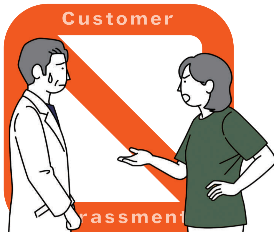
不当・過度な要求